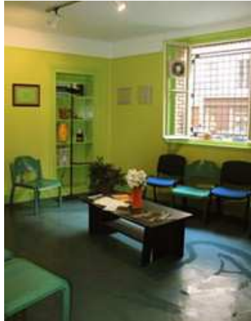
La salle d'attente

Vous pouvez y être reçu pour un premier accueil sans rendez-vous , au cours duquel une évaluation de votre situation pourra être effectuée. A partir de cette évaluation, il vous sera proposé soit une orientation vers une autre structure plus adaptée, soit une prise en charge médico-psychologique et/ou sociale à Marmottan.